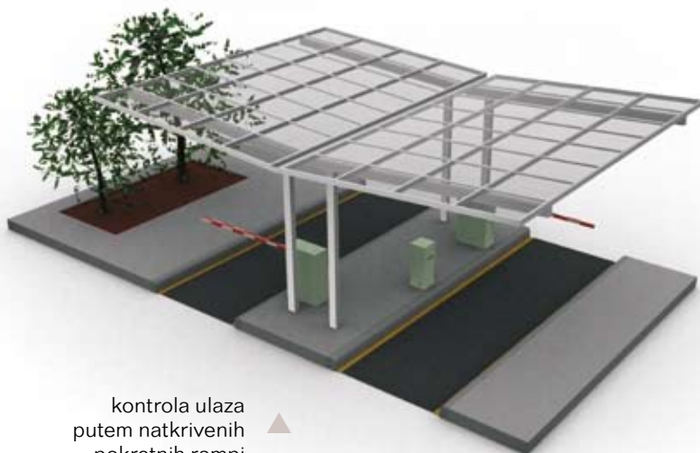
kontrola ulaza putem natkrivenih pokretnih rampi ▲