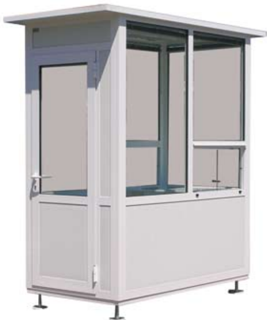
▲ portirnica dimenzija 1,2 x 2,2 m aluminijumska konstrukcija

Kućice za naplatu ili kontrolu, portirnice odnosno kabina za prodaju karata radimo u nekoliko osnovnih modela koji se razlikuju dimenzijama, materijalom izrade i opremom.