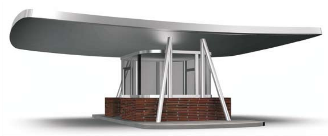
portirnica sa nadstrešnicom ▲

kontrolno mesto za mornara razvijano za potrebe Marine Punit: inox konstrukcija, fasada od laminata u boji drveta, tenda, inox ograda, stepenište, osmatračnica ▼