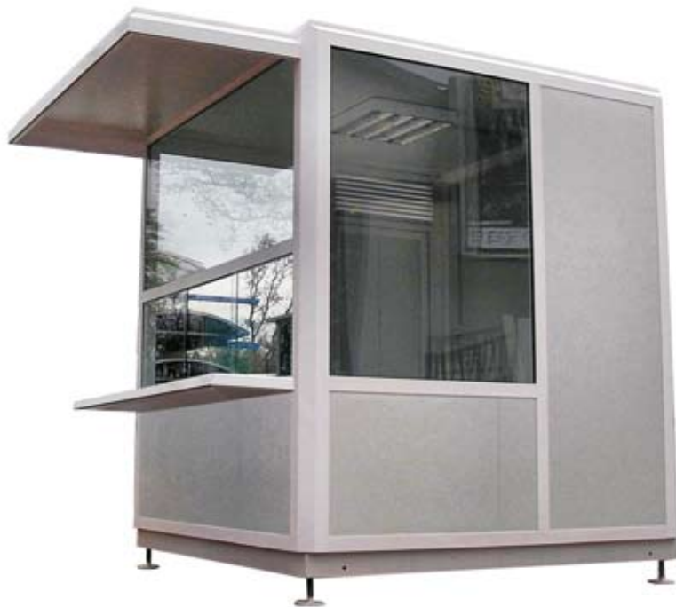
▲ portirnica dimenzija 2,4 x 2,4 m, sa nadstrešnicom i pultom aluminijumska konstrukcija